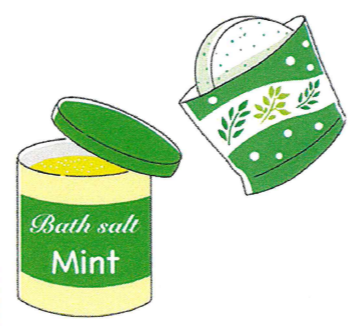
清涼感のある夏向けの入浴剤が豊富にあるのでチェックしてみてください

ほかにもちょっとした工夫で節電に。カーテンやブラインドで直射日光を防ぐとお部屋の快適さもアップ。遮熱カーテンもおおすすめです。暑いと冷感庫を開ける回数も増えますが、開けると冷気が外に漏れ、閉めた時に冷やそうと電力を消費するので、開閉の回数を減らすことも大切です。電力に頼らないアイテムを使うのもおすすめです。涼感タイプの敷きマット