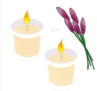
アロマキャンドルで好きな香りを楽しむのも良いですね

ンドルをともしず時間が短いと、中心だけ溶けてしまい、その寿命が短くなるので、1時間以上灯すことで、キャンドルの表面が均等に溶けて、長く楽しめるそうです。火が苦手な人は、LEDキャンドルの温かみのあるあかりでその雰囲気味わうのも良いですし、アウトドアブームで人気のランタンを部屋で使うと、非日常的な雰囲気が楽しめます。