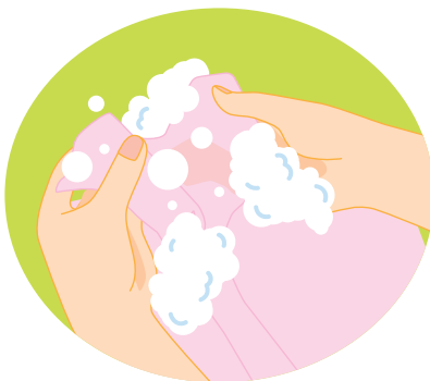
食器用洗剤はつけ過ぎると泡が切れにくくなるので注意しましょう

軽く泡立てた洗剤をめがねのレンズにつけて優しく洗い、水で充分すすいでください。これでレンズはピカピカに！ちなみに、石鹸が主成分のものや、中性以外の洗剤で洗ったり、お湯で流したりすると、かえってめがねを傷めることになるので気をつけましよう。