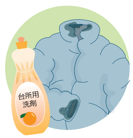
お家で洗えるダウンの袖の黒ずみも食器用洗剤で下洗いすれば、キレイに♪

みにもおすすめ。シミ部分に直接原液をつけて、揉みこんでから洗濯機で洗いまししょう。ちなみに、床敷きマットの蓄積した汗汚れなどは、セスキ炭酸ソーダを洗濯機の水に溶いてつけ置き洗いとすすぎり落ちますよ。