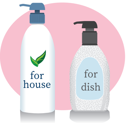
掃除や洗濯用に別のボトルに分けるなど、使い分けをするといいですね

う。量は調整してくださいね。浴室の湯あかもキレイにしたいところ。湯あかは酸性。そこで、弱アルカリ性の食器用洗剤がおすすめです。弱アルカリ性の食器用洗剤と重曹を1対1で混ぜたら、気になるところにつけ、スポンジなどでこすれば、取れやすくなります。