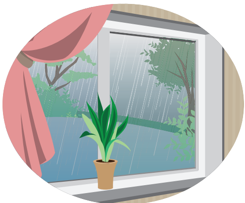
朝の体内リセットは曇りや雨の日でも外を見るだけで効果アリ♪