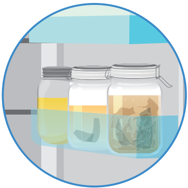
出汁がらを取り除けば冷蔵庫で 3日ほど保存できます。

だし」はいかが？ 冷水ポットなどに 水1リットルに対して昆布15〜20 g、昆布&煮干しまたは昆布&花か つおは、各10gを一緒に入れて6時 間〜8時間。前の夜に入れておけば、 朝には美味しいだしができます。