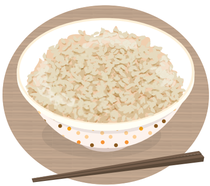
ビタミン B1 は玄米にも多く含まれて いるので、白米に代わりに摂るのも良 いですね！