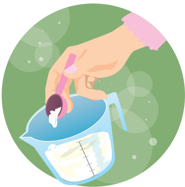
粉洗剤は、ぬるま湯で溶かしてから洗濯に使うと成分が全体に行き渡り効果を発揮します！

しつこい泥汚れや砂がこびりついた子どもの靴下も困りますね。汚れを落とすポイントは「湿気をとる」にあります。砂などの汚れが固まって布にこびりついているので、ひと晩、風通しの良いところに置か、ドライヤーで乾かしてから、はたか、使い古しの歯ブラシなどで砂を