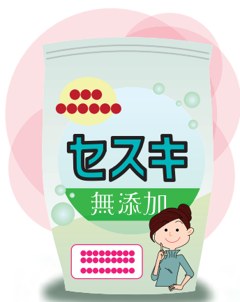
セスキの量は、市販品の表示に合わせて使用してください。

量を溶いて30分程度漬けこんでから洗濯すればすっきり！ちなみに、酸素系漂白剤は、タオルの生乾きや靴下のニオイにも効果的です。