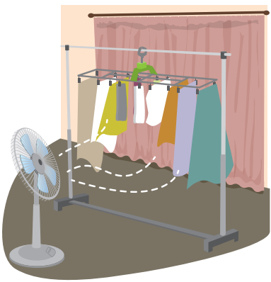
部屋干しは中心に短いものを干す「アーチ干し」がおすすすめ！

洗濯後は干し方も肝心です。たとえば、ハンガーに干すと、脇の部分の布が微妙に重なっていませんか？ここが意外と生乾きになることがあります。ニオイは汗のほかに、服に残った雑菌が原因であることも。そこで、ハンガーに服の裾を洗濯バサミで留め、逆さにバンザイ状態で干す