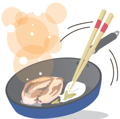
鶏もも肉は、ドレッシングを入れる 前に肉から出た油を取り除いた方が よく絡みます。

はきゅうりやカニかまぼこ、細かく 刻んだわかめ、スイートコーンなど を使えば、彩りも鮮やかです。ほか には、鶏もも肉を焼いて、青じそド レッシングをフライパンに入れてか らめながら仕上げれば、さっぱりと した味が楽しめます。