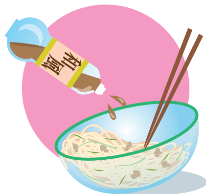
和風パスタは炒めた具とゆでたパスタを ボウルに入れて、和風ドレッシングをあ えてもできます。

和風ドレッシングは海鮮炒めに 使っただけが？シーフードミックス を使えば手軽にできます。食材を 軽く炒めてからドレッシングをかけ