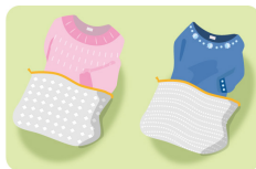
目が粗い 目が細かい

デリケートな衣類を洗うときに重宝する、洗濯ネット。よく見るとさまざまな種類があります。たとえば網目が粗いタイプは、ブラウスやセーターに最適。洗濯中の衣類同士の摩擦や、絡みを防止することで型崩れや素材の傷みを軽減できます。網目が細かいネットは、飾りやホックがついた衣類におすすめ。ほかの衣類にそれらが引っかかることを防いでくれます。また、洗濯ネットには他の使い方も。下着、上着、靴下など洗濯ネット別にして入れて旅行へ。汚れたらそのまま入れれば、洗濯時の仕分けもラクチンです。通気性もあるので、ニットなどの収納にも。個別に入れば摩擦もおさえられ、防虫剤の効果も邪魔しません。さらに、中身が見えやすいので子どものおもちゃの仕分けにもおすすめ。特に、お風呂のおもちゃならそのまま干せばよく乾いて清潔を保てます。