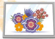
絵はシンプルな額で洗練された雰囲気！

さらに、好きな椅子をひとつ置くと、インテリア性もアップ。ブーツなどを脱ぎ履きするときにも便利なのでおすすめです。