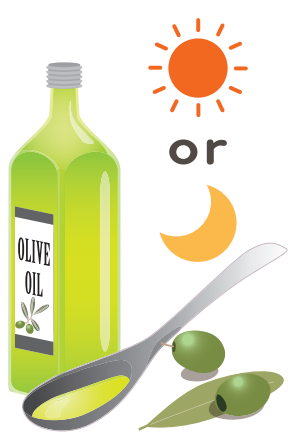
オリーブオイルを飲むのは朝起 きてすぐや寝る前がおすすめ！

がおすすめです。腸の働きがよく なれば、お肌の調子も良くなるので、 うれしいですね。