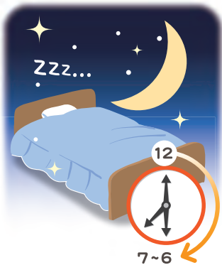
大人の睡眠時間は6～7時間が ベストだそうです！

生活リズムの不規則さも腸を弱ら せる原因のひとつ。食事の時間が不 規則だと、腸の働きがなかなか安定 しません。仕事が忙しいなどの理由 があるかもしれませんが、できる限 り決まった時間に食事を摂ることを おすすめします。また、睡眠時間が 5時間以下、もしくは9時間以上と いった極端な例も良くないそうで す。